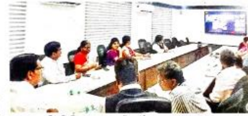
వచ్చేవరకే ప్లాటిఫామ్ ప్రారంభమవుతున్న అసీ-వ్యాగ్ టీం, వ్యా.వ రిజిస్టర్, రిగ్యర్ యంబలు

ప్రా.వరాచర్.సీ.టి. ప్రొ.వ.07 (ఆంధ్రప్రదేశ్): ప్రా.వరాచర్.సీ.టి. ప్రొ.వ.07 (ఆంధ్రప్రదేశ్) కేసీసీయూ అనుబంధ కాలేజీల విద్యార్థులను ఆన్ లైన్ క్లాసులు పురు. వచ్చేవరకే ప్లాటిఫామ్ ప్రారంభించిన అసీ-వ్యాగ్ టీం బాంబే ప్రొజెక్ట్. వచ్చేవరకే ప్లాటిఫామ్ ప్రారంభించిన అసీ-వ్యాగ్ టీం బాంబే ప్రొజెక్ట్. వచ్చేవరకే ప్లాటిఫామ్ ప్రారంభించిన అసీ-వ్యాగ్ టీం బాంబే ప్రొజెక్ట్.