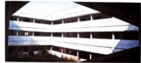
An inside view of Potti Sreeramulu Telugu University.

The Legislative Assembly on Monday passed a legislation amending the Potti Sreeramulu Telugu University Act 1985 even as Chief Minister A. Revanth Reddy has announced that the Cherpally railway terminal will be named after Potti Sreeramulu as mark of respect to his contributions in freedom struggle and his role in carving out of the Andhra State. In another important announcement, the Chief Minister said the nature cure hospital at Balkampet will be named after former Chief Minister of united AP K. Rosaiah and his statue will be erected on the