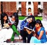
అక్షరాస్యత కోసం చిన్న పాఠశాలలు ఏర్పాటు చేయాలి.

ప్రతి పాఠశాలలో చిన్న పాఠశాలలు ఏర్పాటు చేయాలి. ప్రతి పాఠశాలలో చిన్న పాఠశాలలు ఏర్పాటు చేయాలి. ప్రతి పాఠశాలలో చిన్న పాఠశాలలు ఏర్పాటు చేయాలి.